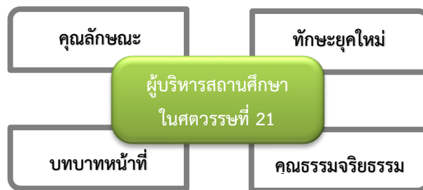
ภาพประกอบที่ 1 องค์ประกอบคุณสมบัติของผู้บริหารสถานศึกษาในศตวรรษที่ 21 ตามแนวคิดของ ชัยยนต์ เพาพาน

คุณสมบัติของผู้บริหารสถานศึกษาศตวรรษที่ 21 ผู้บริหารสถานศึกษาในศตวรรษที่ 21 ต้องมีคุณลักษณะที่โดดเด่น มีทักษะ และบทบาทในการบริหารการเปลี่ยนแปลงให้ได้อย่างมีประสิทธิภาพ การใช้ข้อมูลและสารสนเทศเพื่อใช้ในการกำหนดยุทธศาสตร์และนำไปสู่การปฏิบัติในอนาคต และต้องมีคุณธรรมจริยธรรมควบคู่กันในการบริหารสถานศึกษา จากการศึกษาแนวคิด ทฤษฎี และงานวิจัยของนักวิชาการทั้งในและต่างประเทศ สามารถกำหนดประเด็นศึกษาที่สำคัญ 4 ด้านหลัก ได้แก่ คุณลักษณะ ทักษะยุคใหม่ บทบาทหน้าที่ และคุณธรรมจริยธรรม (ชัยยนต์ เพาพาน, 2559, น. 304) ดังภาพประกอบที่ 1